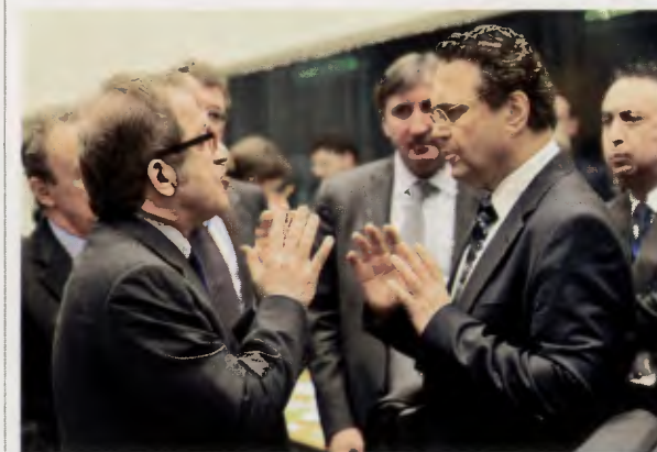
Innenminister Maroni, Friedrich in Luxemburg Selten war die EU so uneins

Die österreichische Innenministerin Maria Fekter sagte, Italien sei ein großes Land, „es kann schon ein bisschen guten Willen zeigen“. Auch der deutsche Innenminister Hans-Peter Friedrich blieb hart gegenüber seinem italienischen Amtskollegen. „Italien muss seiner Verantwortung gerecht werden“, sagte Friedrich, die Ausstellung von