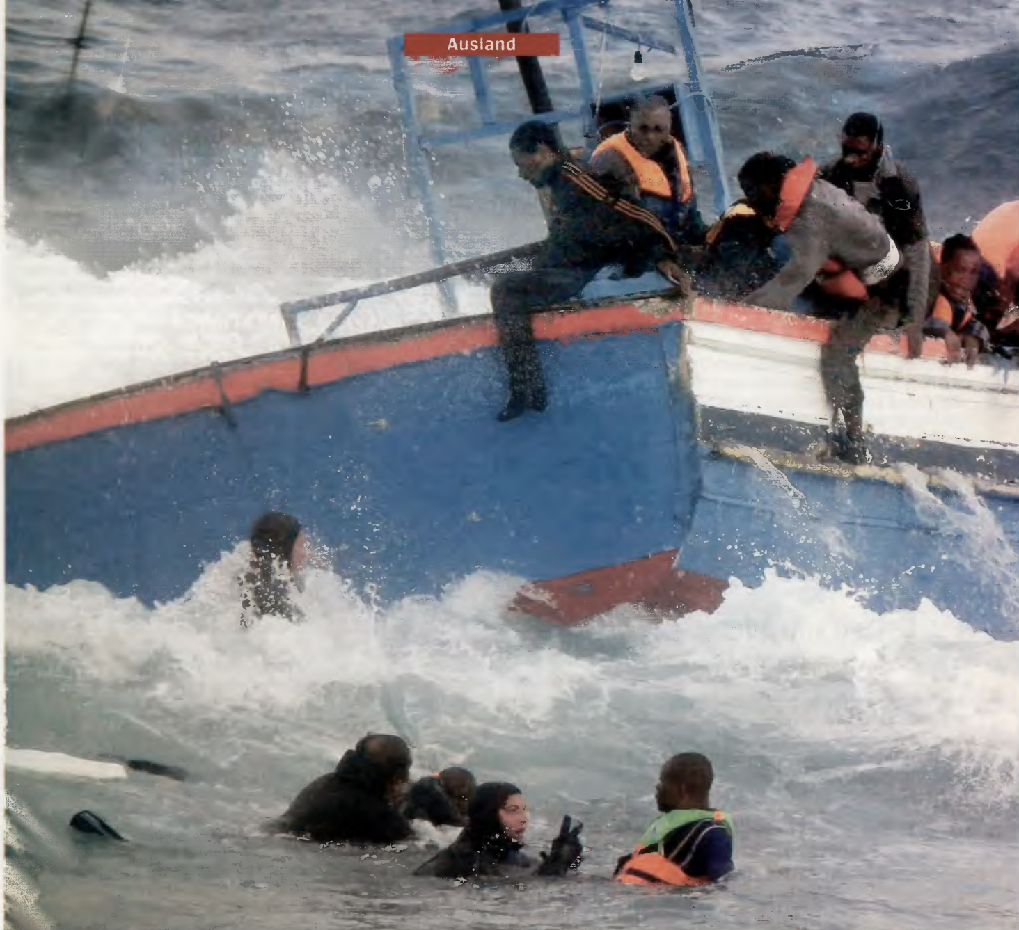
Bergung von Flüchtlingen vor der italienischen Insel Pantelleria: „Erst klatscht ihr Beifall, dann jagt ihr uns“