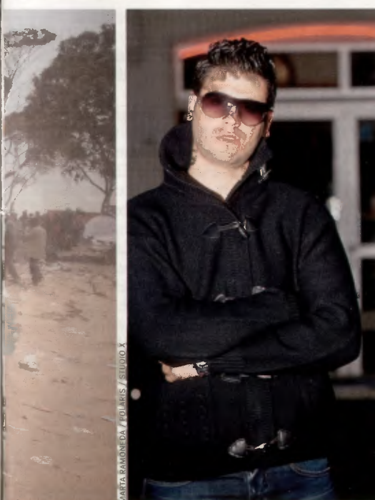
„Wir brauchen dieselben Standards“

Mit diesen Ansichten wird Cecilia Malmström, die EU-Kommissarin, wenig Zustimmung finden in Frankreich, dem Land, in das die meisten Tunesier streben. Doch es gehe nicht nur um Solidarität gegenüber Italien, sagt sie, sondern vor allem gegenüber Tunesien. „Wir erleben eine außergewöhnliche Demokratisierungswelle, und die Tunesier haben die-