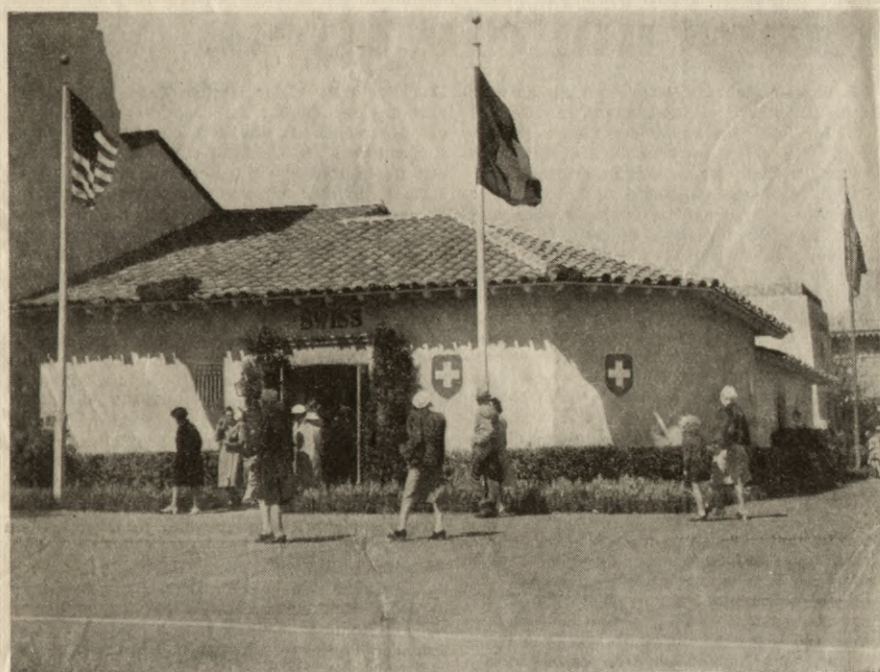
Das Schweizerhaus in der Internationalen Ausstellung in San Francisco.