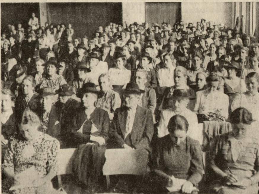
Schweizerische Kindergärtnerinnen-Tagung in Basel. Bekanntlich hat vor hundert Jahren der Pestalozzi-Schüler Friedrich Fröbel den ersten Kindergarten gegründet. Mit diesem Jubiläum fielen die schweizerischen Kindergärtnerinnen-Tage in Basel zusammen. Unser Bild zeigt die versammelten Kindergärtnerinnen aus der ganzen Schweiz während einem der hochinteressanten Referate.