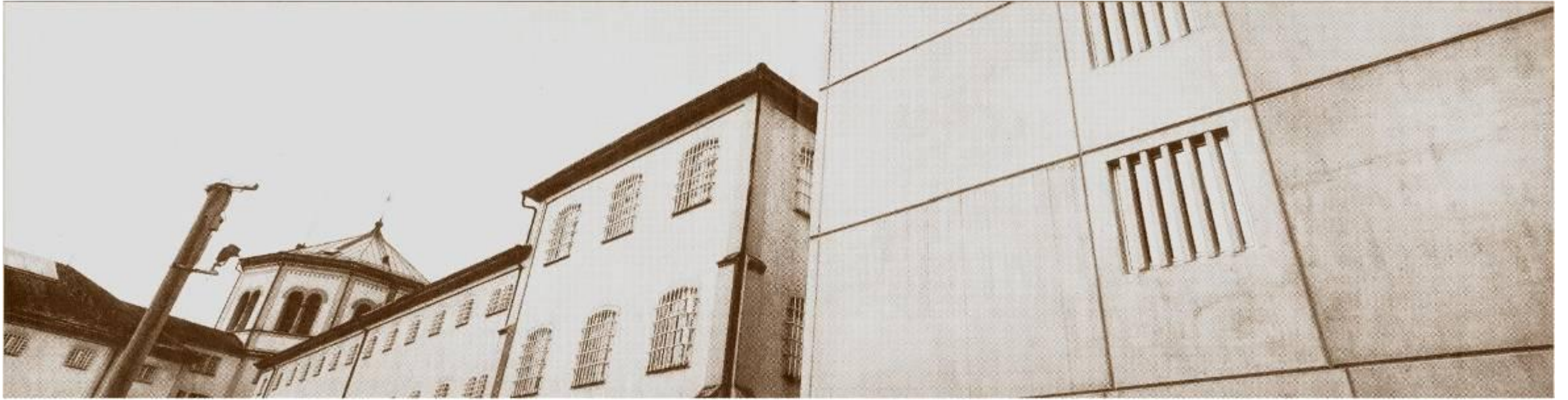
Dem alten, sternförmigen Zuchthaus von Lenzburg ist ein Hochsicherheitstrakt aus vorfabrizierten Elementen angefügt, ein ausbruchssicherer Betonklotz.