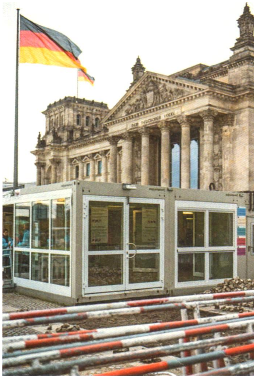
Checkpoint am Reichstag in Berlin Pilotprojekte gegen Terrorplots